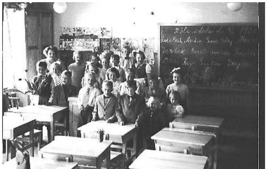
De två sista klasserna våren 1951