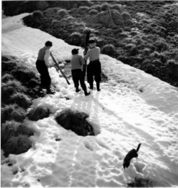
Våren är kommen