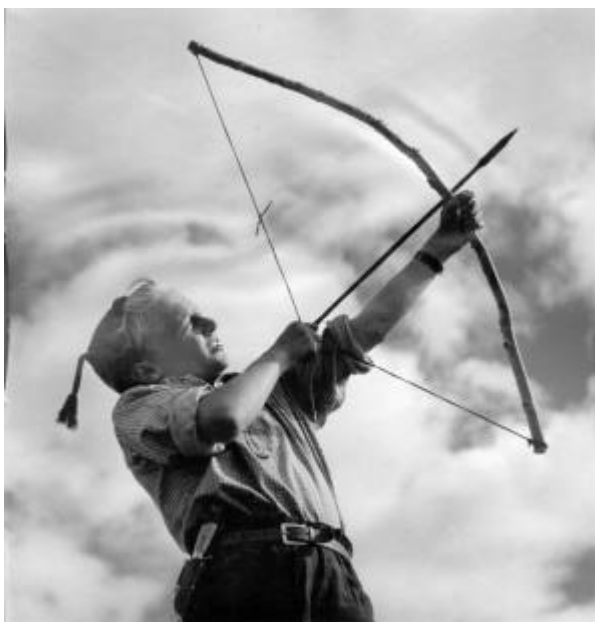
Indianer och vita